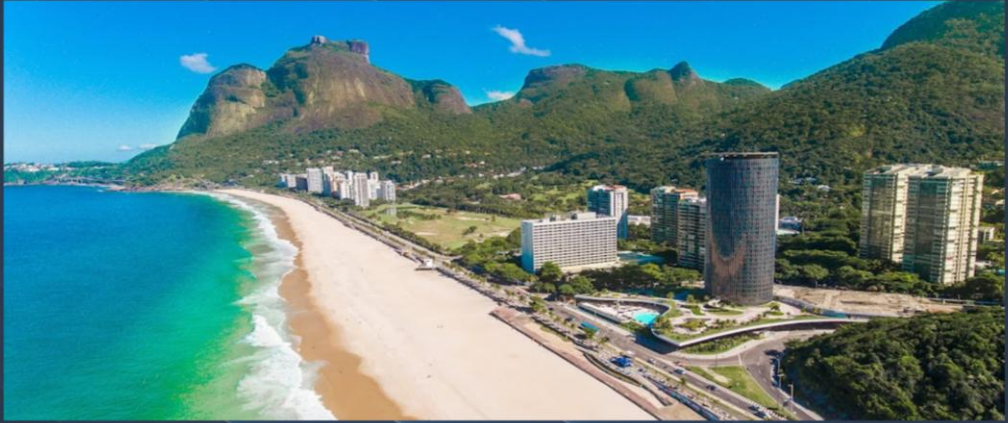
Plage de São Conrado